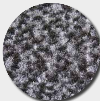
Fibres de polypropylène mouchetées